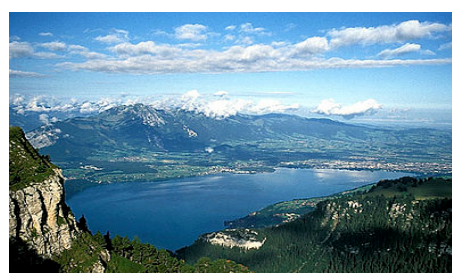
Lac de Thoune depuis le Niederhorn

Nous lançons un appel aux membres motivés : faites acte de candidature pour rejoindre le comité. Il s'agit d'un travail créatif et captivant. Il procure des contacts intéressants et énormément de satisfaction.