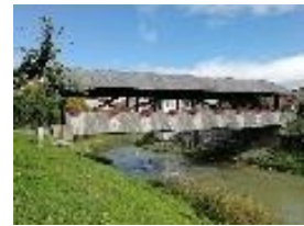
Le pont en bois de Moudon

En raison du Covid 19, toutes nos manifestations, prévues en 2020 ont été annulées. Par contre la vérification des comptes 2019 a été faite et les comptes approuvés.